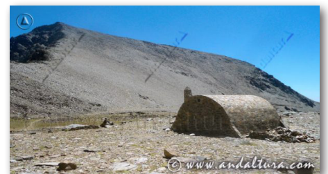
REFUGIOS DE SIERRA NEVADA GUÍA DE REFUGIOS