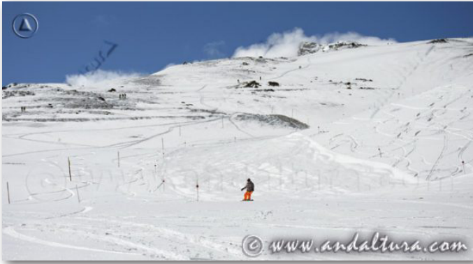
ESTACIÓN DE ESQUÍ Y MONTAÑA SIERRA NEVADA

También dentro del apartado de Sierra Nevada encontraréis distintos apartados sobre: