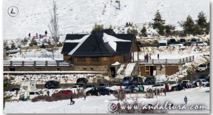
ESTACIÓN RECREATIVA PUERTO DE LA RAGUA