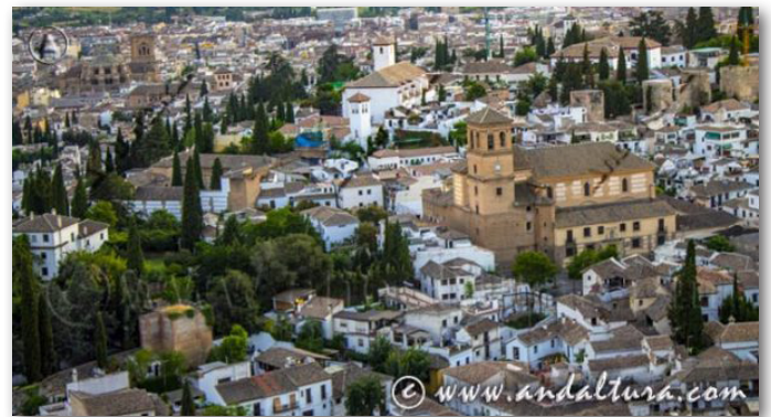
CALLEJERO DEL ALBAYCÍN

Además de los siguientes MONOGRÁFICOS Especiales