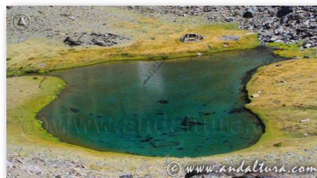
HUELLAS GLACIARES LAGUNAS DE SIERRA NEVADA