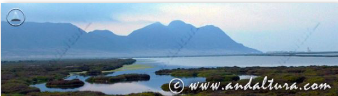
ESPACIOS NATURALES PROTEGIDOS

Además de los siguientes MONOGRÁFICOS Especiales