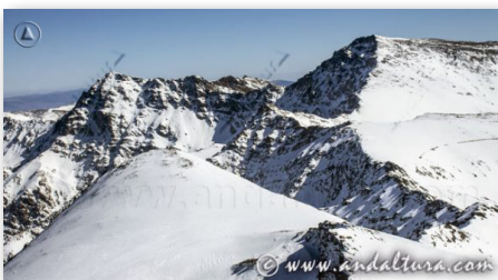
ALTA MONTAÑA DE ANDALUCÍA LOS TRESMILES DE SIERRA NEVADA

En el segundo, SIERRA NEVADA , trataremos sobre su situación, clima, formación y otros aspectos de Sierra Nevada, de diferentes panorámicas ampliadas de distintas zonas del mismo, de la Normativa de Acampada y de los principales Endemismos que nos podremos encontrar en las Rutas de Senderismo que os pondremos realizar y que esperamos que os sirvan para adentrarnos y conocer mejor este espectacular Espacio Natural.