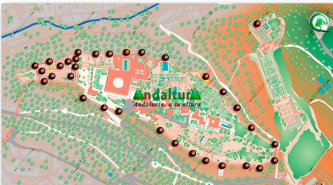
TORRES DE LA ALHAMBRA

Además, podéis consultar unos especiales sobre las Torres y las Puertas de la Alhambra, algunas de las cuales aún mantienen su función actualmente para adentrarnos en ella. Indiscutiblemente todos nuestros contenidos se centrarán sobre los recorridos por el interior de la zona visitable del Conjunto Monumental, pero también encontraréis otras rutas que os permitirán unir este tanto con el Sacromonte y el Albaycín como con otros lugares del cercano Parque Periurbano del Generalife.