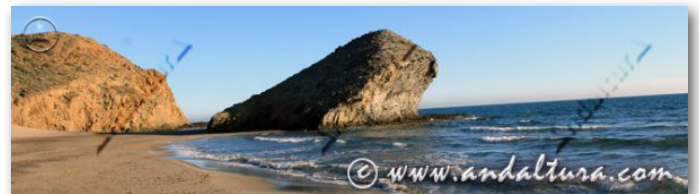
LITORAL Y GUÍA DE PLAYAS DE ALMERÍA

Clasificados por su Tipo y Grado de Protección y donde podrás ampliar Contenidos de los lugares que os proponemos recorrer. Numerosos Mapas Interactivos para acceder más fácilmente a cada uno de ellos.