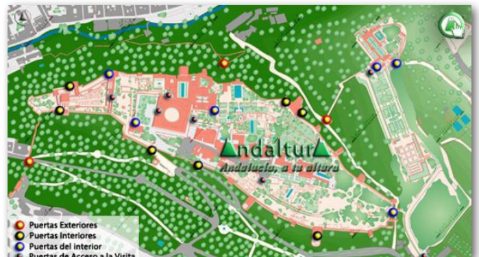
PUERTAS DE LA ALHAMBRA