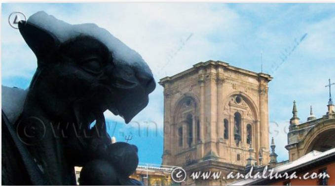
CALLEJERO DE GRANADA

En el primero, ANDALUCÍA , encontraréis diversos contenidos sobre su Situación, Historia, Clima, Relieve, Ríos; Comarcas, Provincias y Capitales; además de poderos descargar los Callejeros más actualizados del Mercado sobre la de Granada y sobre el barrio del Albaycín, donde aparecen indicadas los principales Monumentos y los Lugares de Interés más importantes de cada uno de ellos.